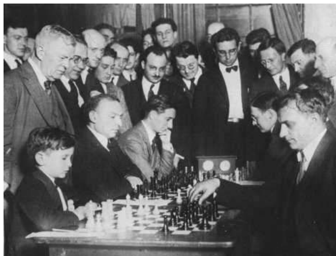
Samuel Reshevsky à l'âge de 11 ans contre le Maître Charles Jaffe

Puis cette course à la jeunesse continua avec L'Ukrainien Sergey Karjakin en 2002, qui obtenait ce titre prestigieux de GMI à 12 ans et 7 mois. Il détient actuellement toujours ce record de précocité.