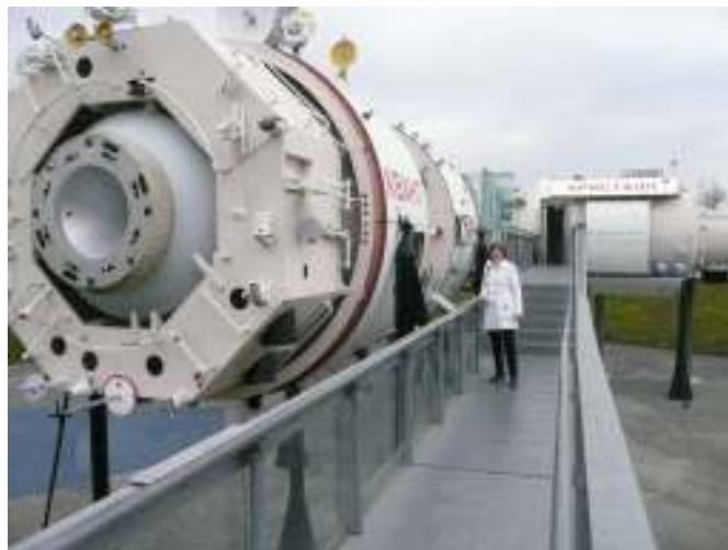
La station MIR. Vous souvenez-vous des prédictions délirantes d'un certain Paco Rabanne ?

Revenons à l'aspect sportif de notre déplacement. De mon côté, je m'étais dit qu'un entraîneur qui ne joue jamais perd de sa crédibilité. Je n'ai pas démerité, mais sans briller je termine avec une performance conforme à mon classement (environ 2320). Je battais les moins forts et me faisait remettre