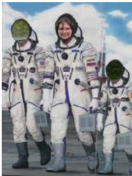
Prête à embarquer !