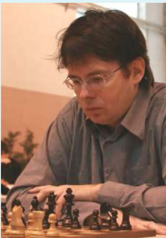
Manifestement je ne rigole pas !

Pour terminer voici une petite partie agréable de mon côté !