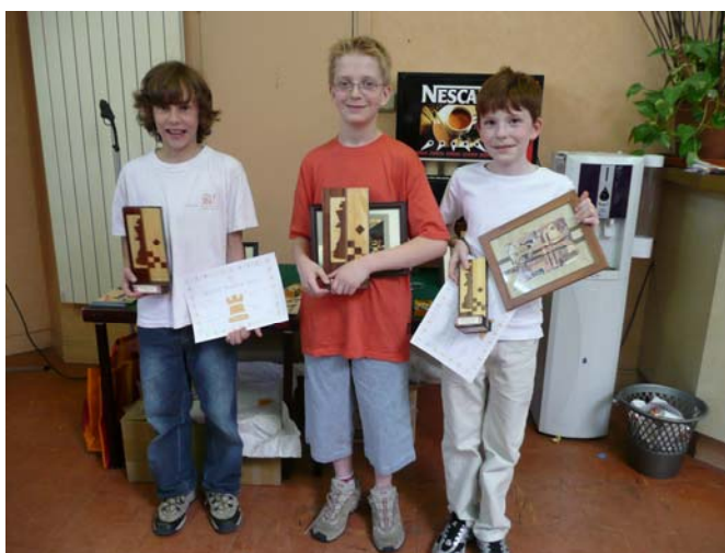
Les trois premiers du tournoi.

Vous trouverez sur la page suivante l'intégralité du classement de cette 10ème édition.