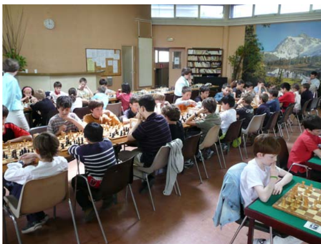
Vue générale du tournoi

Il laisse derrière lui de redoutables concurrents. Une troisième place méritée !