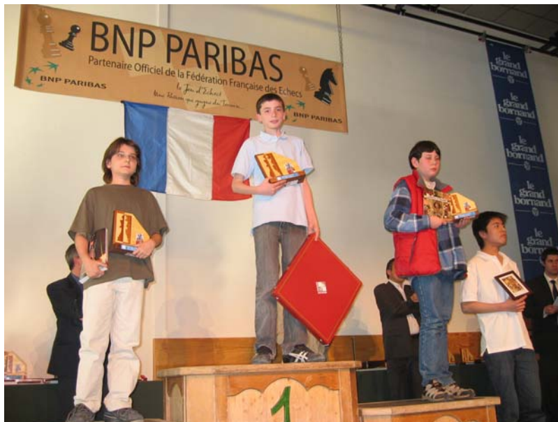
Au Grand-Bornand sur la plus haute marche du podium

Au nom de toute l'association nous lui souhaitons tous nos vœux de réussites !