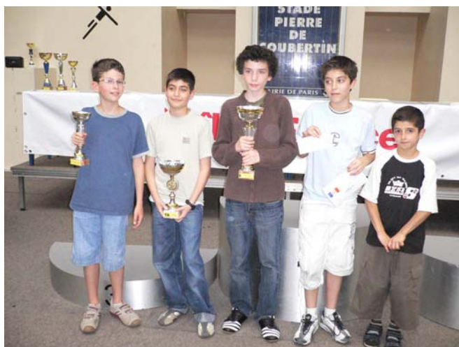
Quelques Saint-Mandéens après la remise des prix

Et comme chaque année depuis trois ou quatre ans, elle participe au championnat de Paris.