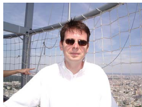
Votre serviteur pour le bulletin !